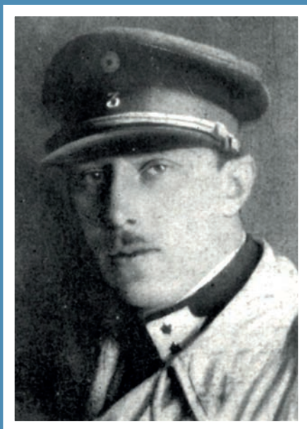
Arnould van de Walle (1898–1944)